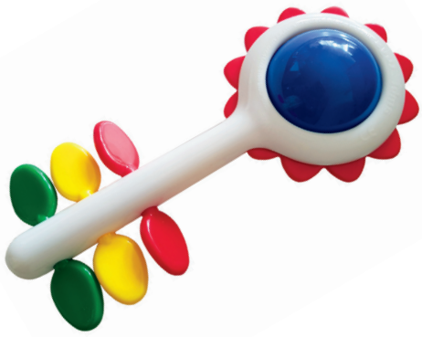
Sonaglio grande (A)