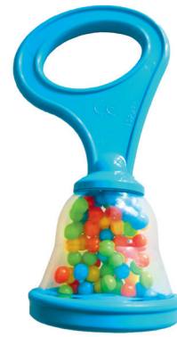
Sonaglio con impugnatura piccola (B)